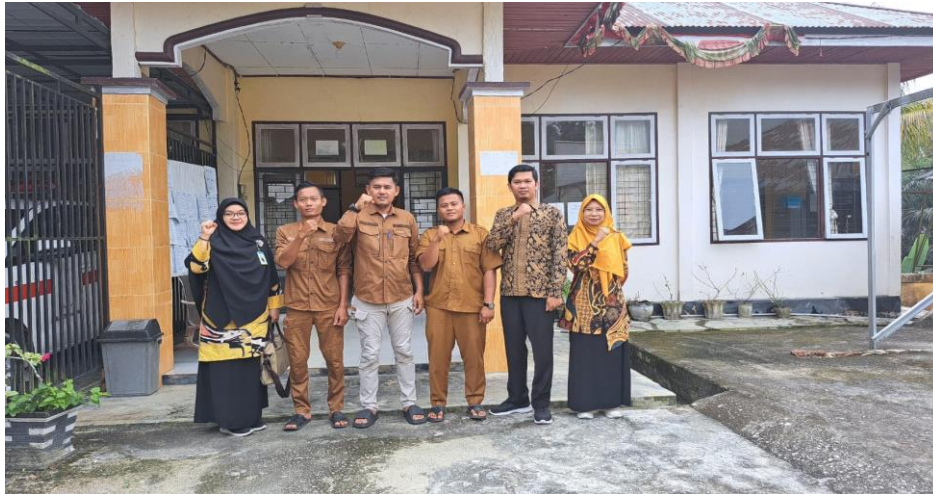
Gambar 3. Dokumentasi Koordinasi dengan Pemerintahan Desa Ranah Singkuang