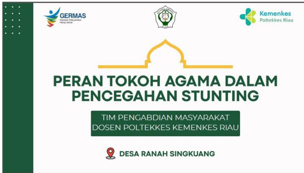
Gambar 5. Power Point

stunting, Ciri-ciri stunting, strategi penanganan stunting dan peran tokoh agama dalam pencegahan stunting.