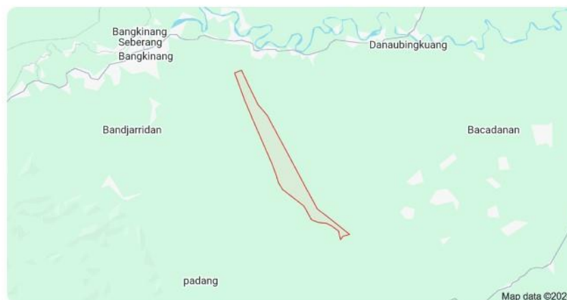
Ranah Singkuang Kec. Kampar, Kabupaten Kampar, Riau