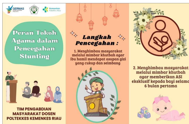
Gambar 6. Tampak Depan Leaflet

Media kedua yang digunakan dalam penyampaian materi selanjutnya ialah leaflet yang berisi mengenai pengertian stunting, cara mencegah stunting dan peran tokoh agama dalam pencegahan stunting yang disusun secara ringkas berdasarkan pada power point . Tokoh agama dan remaja masjid dibekali leaflet karena leaflet lebih mudah dibawa kemana-mana dan memudahkan Tokoh agama dan remaja masjid untuk selalu mengingat dan mempelajari materi yang telah diberikan.