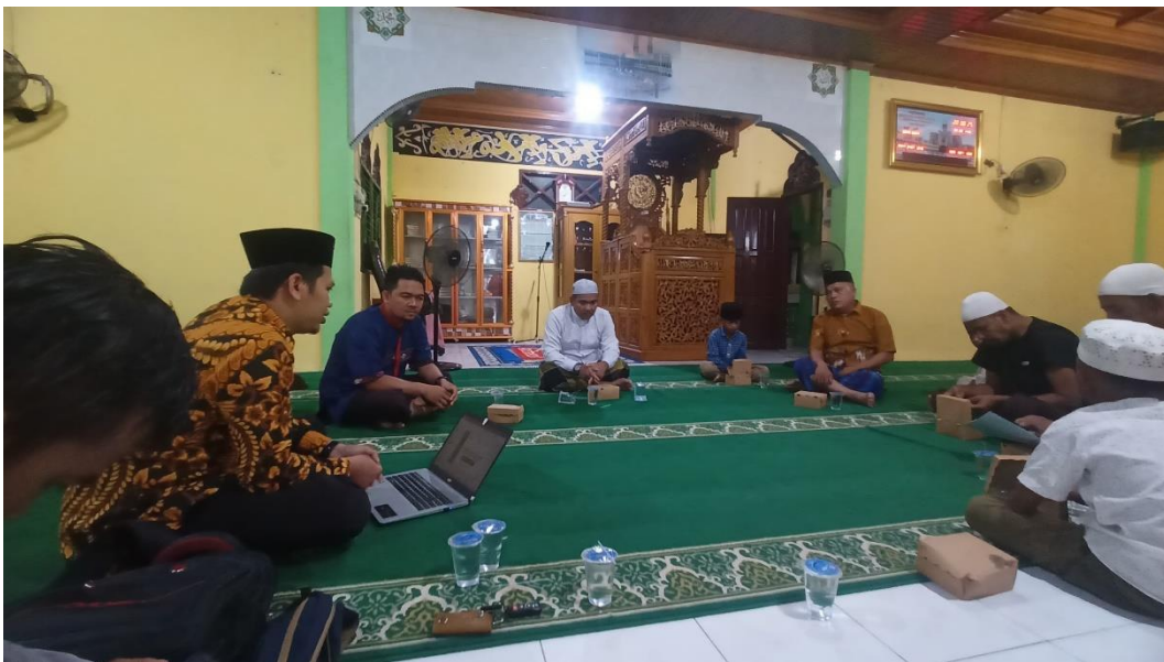
Gambar 4. Penyuluhan Tentang Stunting

Setelah tokoh agama dan remaja masjid menyelesaikan pre-test, tahap berikutnya adalah memberikan penyuluhan mengenai pencegahan stunting. Penyuluhan ini dilakukan melalui metode ceramah secara langsung atau tatap muka, yang dihadiri oleh 15 tokoh agama dan remaja masjid. Selama kegiatan penyuluhan, respon dari tokoh agama dan remaja masjid yang hadir cukup positif.